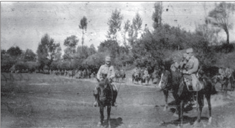
Bild 5: „Wir marschieren wieder vor, gegen Tatorynow“. 7. September 1914

In der siebenten Abteilung, der zweite Teil des Tagebuchs, welcher den ausdrucksvollen Titel „Ereignisse“ trägt, beschreibt der Offizier Leopold Prohaska mit einer schriftstellerischen aber auch minuziösen Genauigkeit die täglichen Ereignisse an der Front. Der k.u.k Offizier konzentriert sich in seiner Arbeit sowohl auf die militärischen Ereignisse und Einsätze, auf die militärischen Strategien die von dem hohen Stabskommando geplant worden waren, als auch auf die Lebenserfahrungen, die das Bataillon auf dem Kriegsfeld gemacht hatte. Die Darstellungen erfassen viele Aspekte der Front, sowohl was das Alltagsleben der Soldaten angeht als auch die militärischen