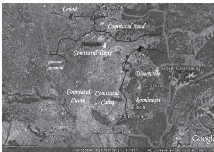
Fig. 2. Organizarea administrativă a Banatului, în sec. XIV-XV.

rege arpadian nu reprezintă etapa de început a creării comitatului nobiliar, ci finalul acestui proces instituțional.