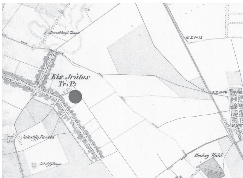
Pl. I. Harta a Bazinului Carpatic cu localizarea comunei Dorobanți Dorobanți. 2. Hartă de secolul al XVIII-lea cu localizarea C.A.P.-ului Dorobanți.

Plate I. 1. Carpathian Basin map with the localization of Dorobanți; 2. XVIIIth century map of Dorobanți area with the localization of „Sediul C.A.P.” site.