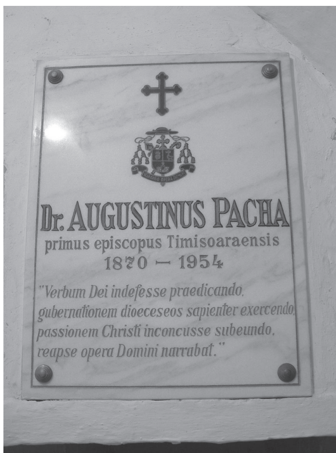
Foto. 3 Piatra funerară a episcopului Augustin Pacha din cripta Domului din Timișoara